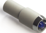
cilindro de cobalto cromo para micro pilares CL.MC.00002-P