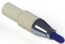
UCLA para RC (CoCr) PL.RC.35002-P