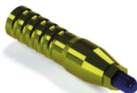
UCLA para RC (titânio) PL.RC.00014-T

*marca registrada pertencente a um terceiro, não relacionada a HealTech LTDA-ME