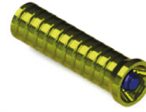
cilindro de titânio para micro pilar IN.RC.00002-T